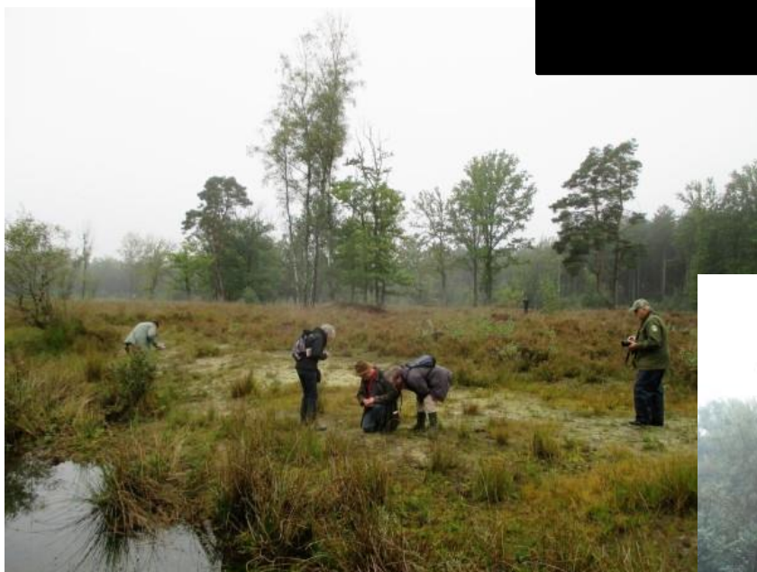
Op 19 september zaten we weer terug in onze geliefde biotoop