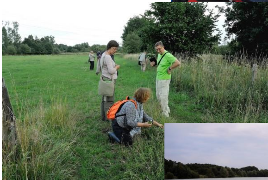
Op 19 juli gingen we op schoolreis naar het Munsterbos