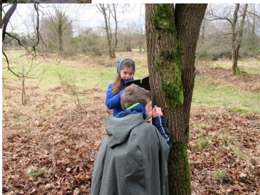
Op 28 februari was de jeugd aan zet