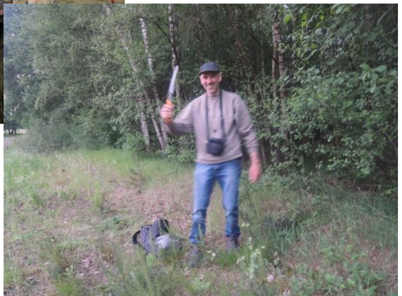
Op 31 mei werd het groot gerief bovengehaald