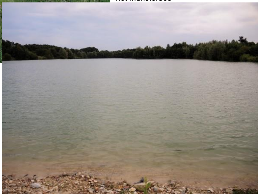
26 juli de zon de .....