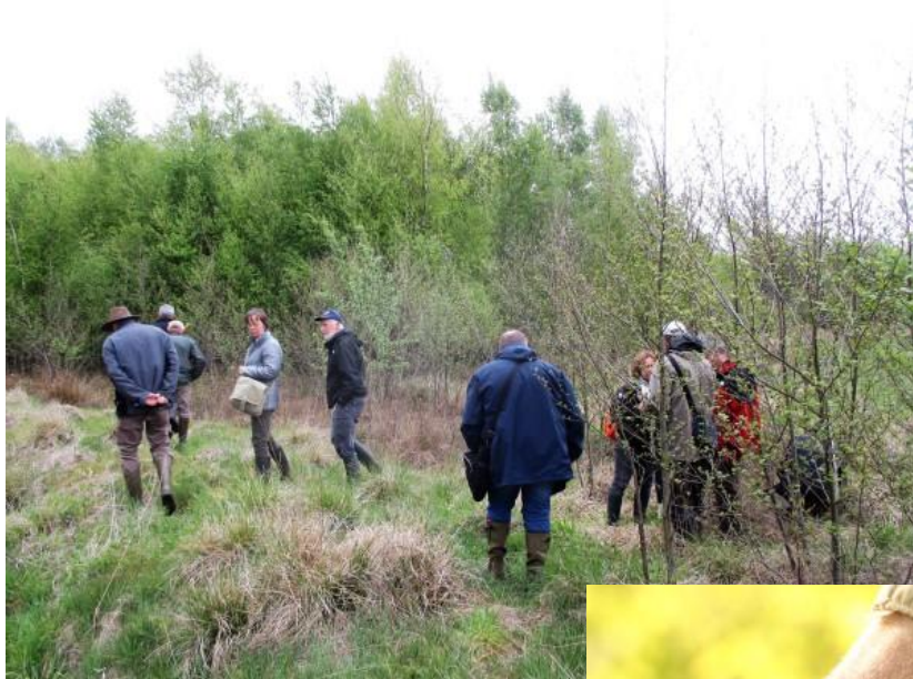
In mei leggen alle vogels een ei maar op de 3 e waren de slobkousjes nog op zoek naar een goede nestplaats