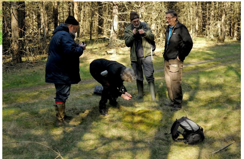
Op 28 maart zochten en vonden we het struisveermos