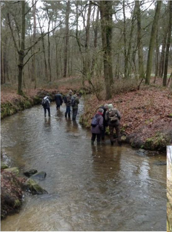
Op 7 maart was het dinsdag visdag