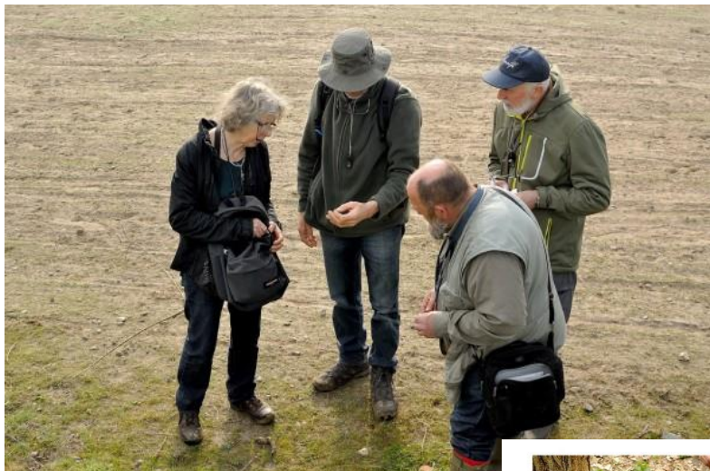
Op 4 april was het maar een kale bedoeling