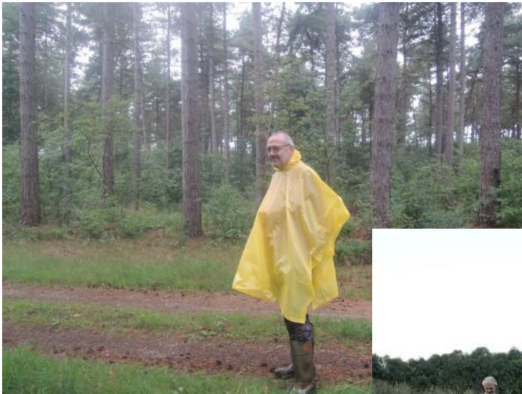
2 augustus en het water viel met bakken uit de hemel