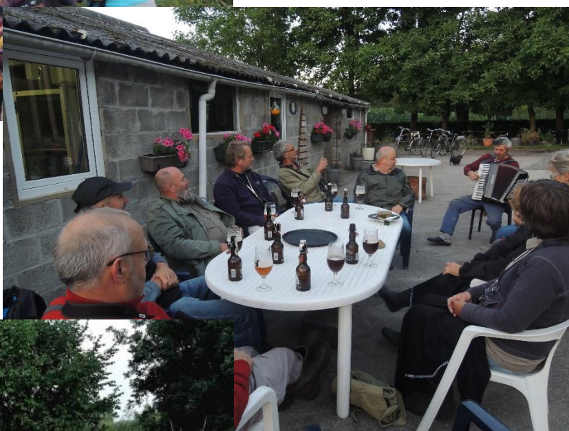
De verslaggever had op 12 juli nog maar net zijn rug gekeerd of.....