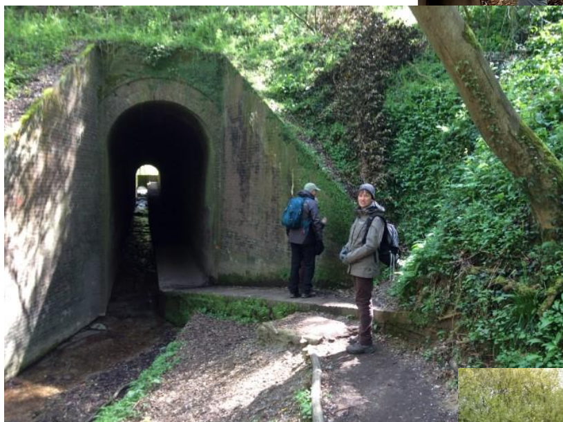
18 april en eindelijk licht op het einde van de tunnel we konden aan het plantenseizoen beginnen!