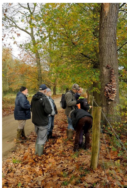
Op 31 oktober was er vooral aandacht voor paddenstoelen op ooghoogte