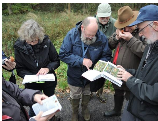
Op 24 oktober werd het beste boek verkozen