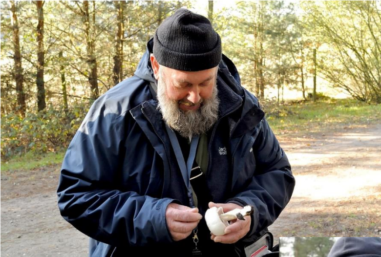
Op 7 november ontdekten we de champignon spec