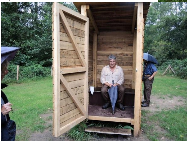
29 08 Ook slobkousjes moeten zich af en toe discreet kunnen terugtrekken