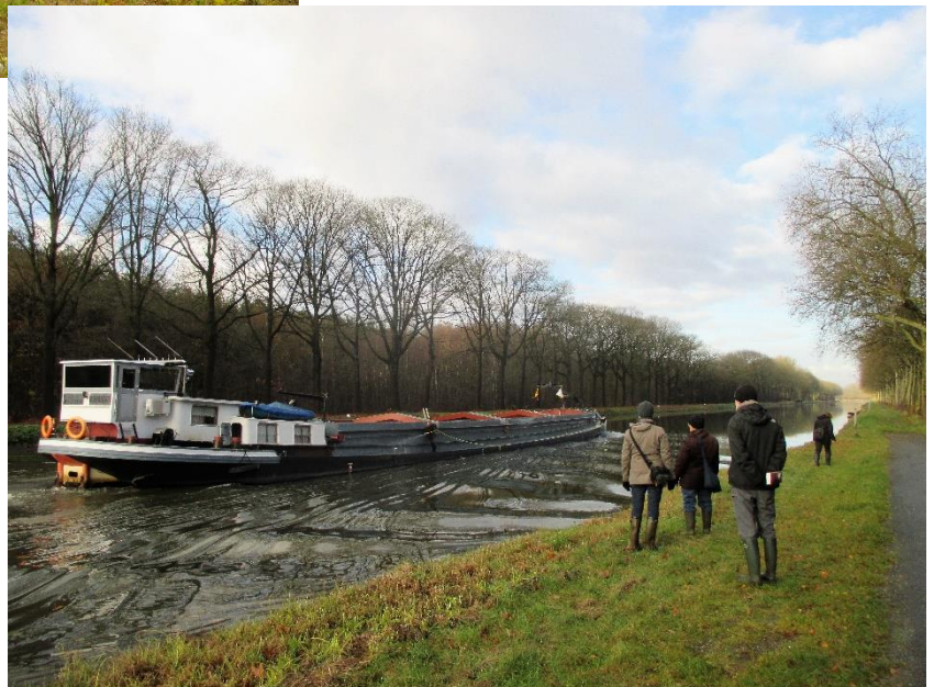
28 november schipper mag ik overvaren ja of neen