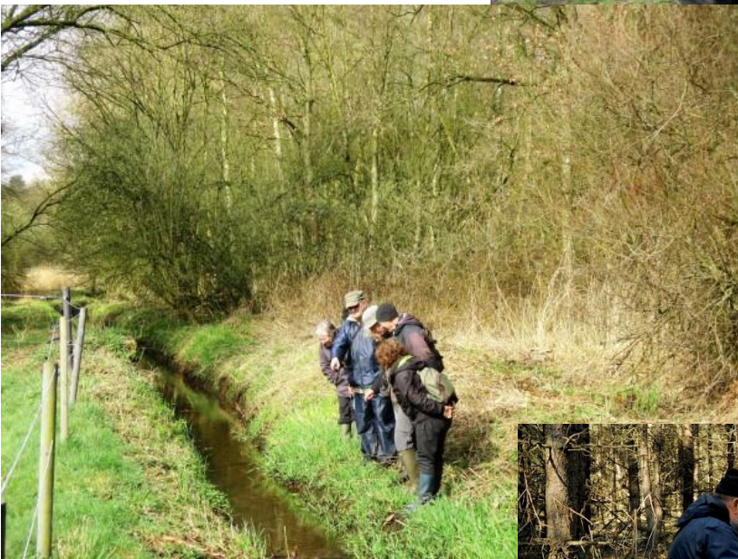
We waren al 21 maart maar de passie voor beken bleef