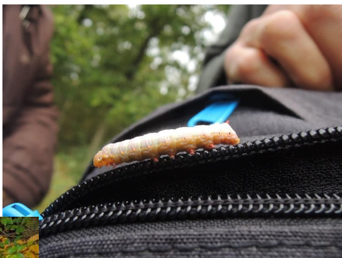
Op 10 oktober bracht een Slobkous haar huisdier mee naar de wandeling