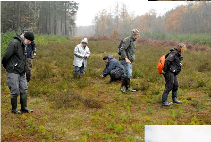
Op 21 november gingen we in het slijkven rondneuzen