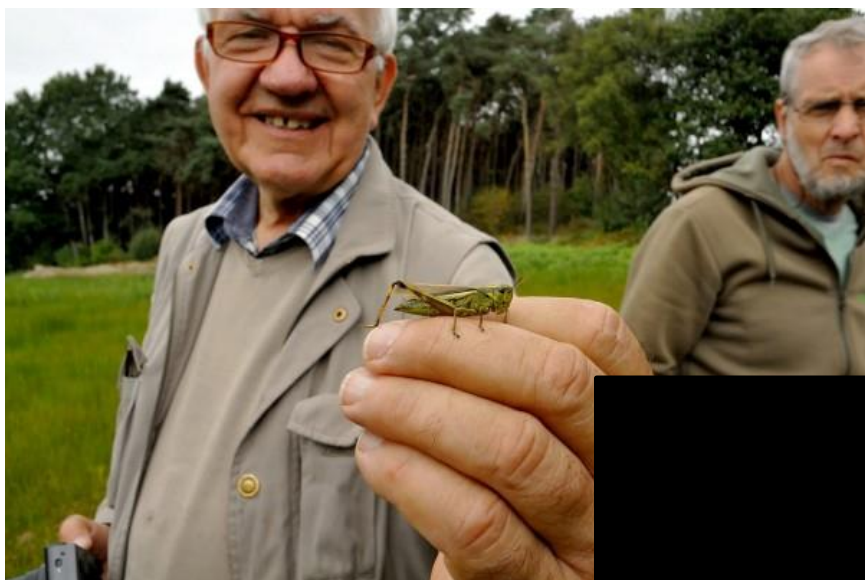
Op 5 september begonnen we de najaarswandelingen Gefrituurd is dat echt wel lekker