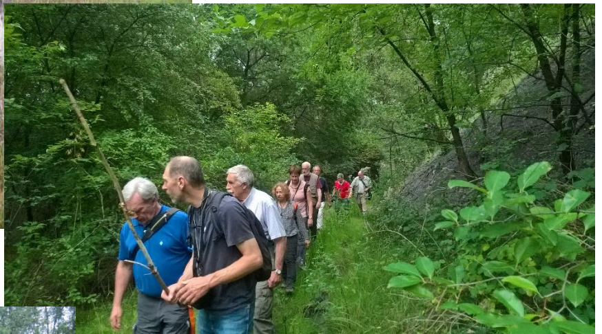
23 augustus op verkenning in een stuk mijnverleden