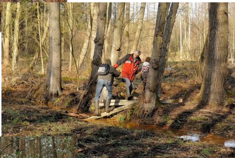
Op 14 februari werden er evenwichtsoefeningen gehouden