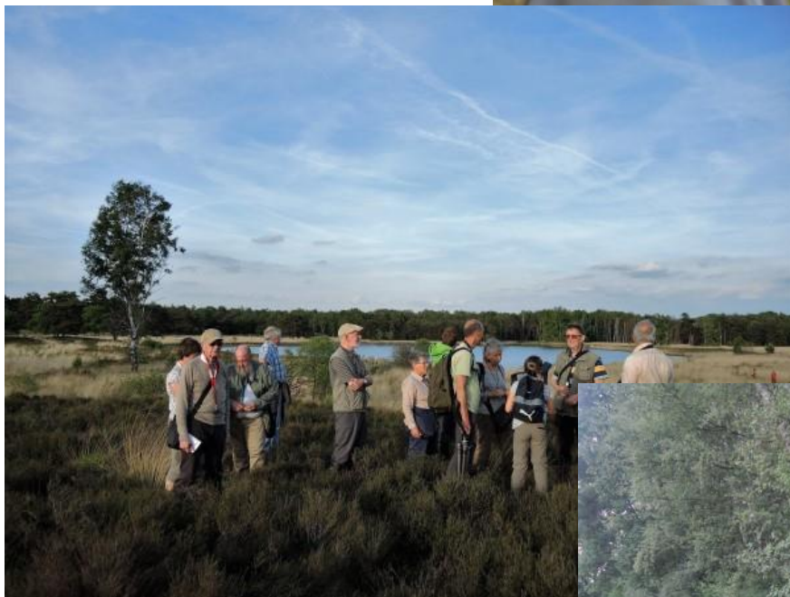
Op 24 mei moesten ze al de schaduw opzoeken