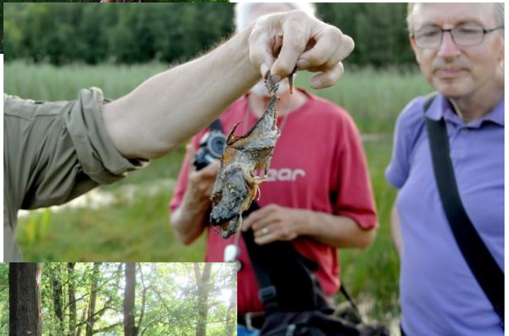
Op 14 juni werd duidelijk dat vissen niet onze sterkste kant is