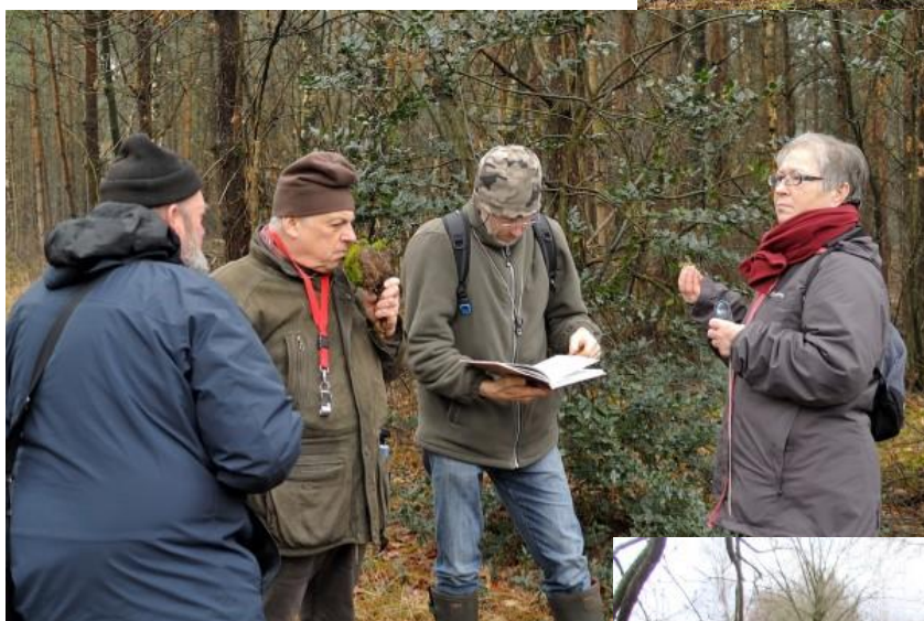
Op 21 februari nam Zee resoluut de leiding in handen