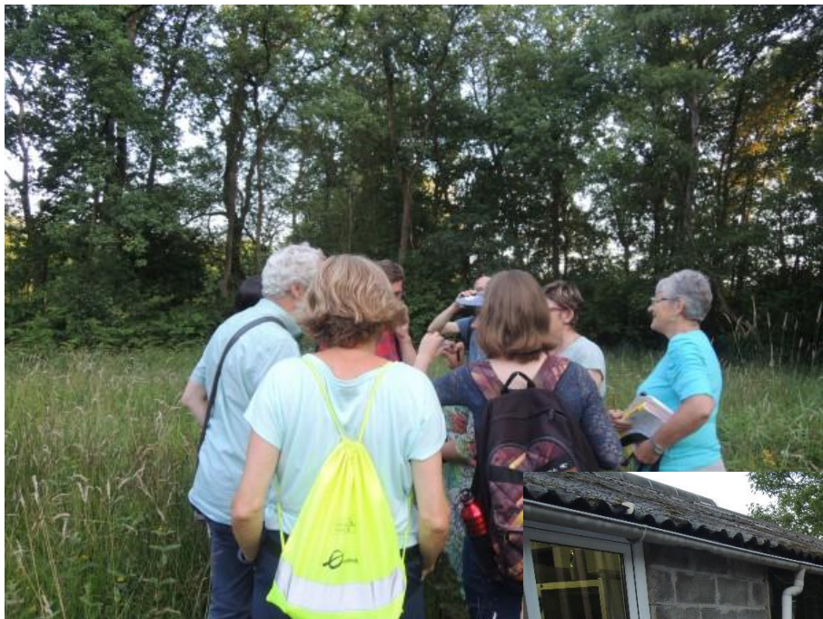
5 Juli en de vervrouwelijking is volop aan de gang