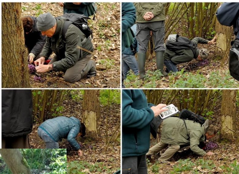
Op 11 april waren er tekenen van radicalisering merkbaar