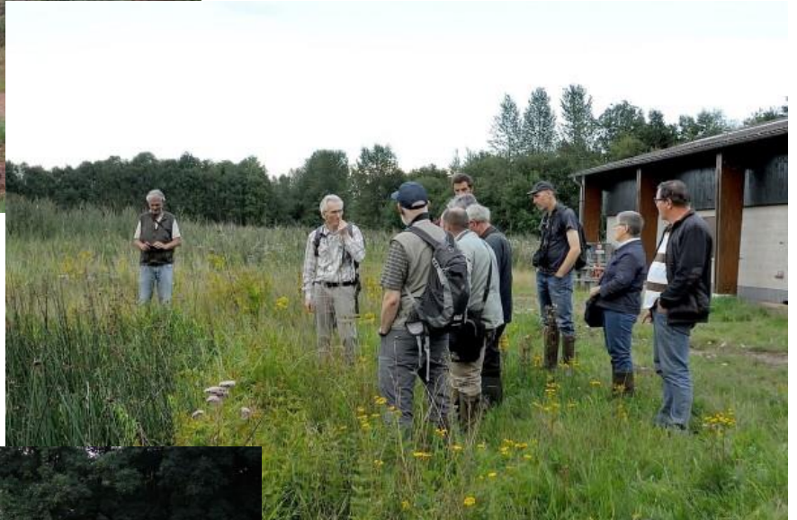
9 augustus ook hier kan je niet meer vissen