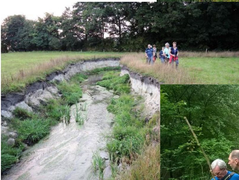
16 augustus waar de Dommel terug meandert