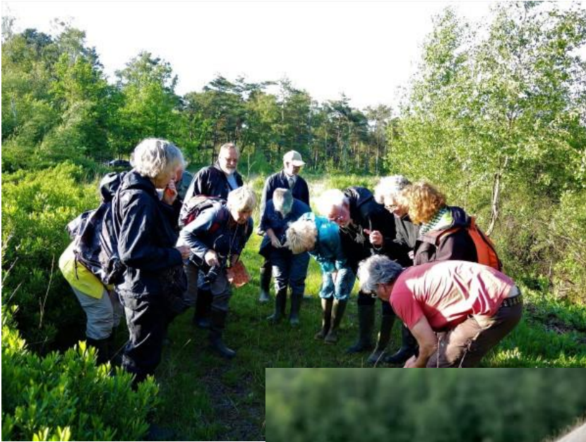
Op 7 juni moesten ze allemaal helpen zoeken