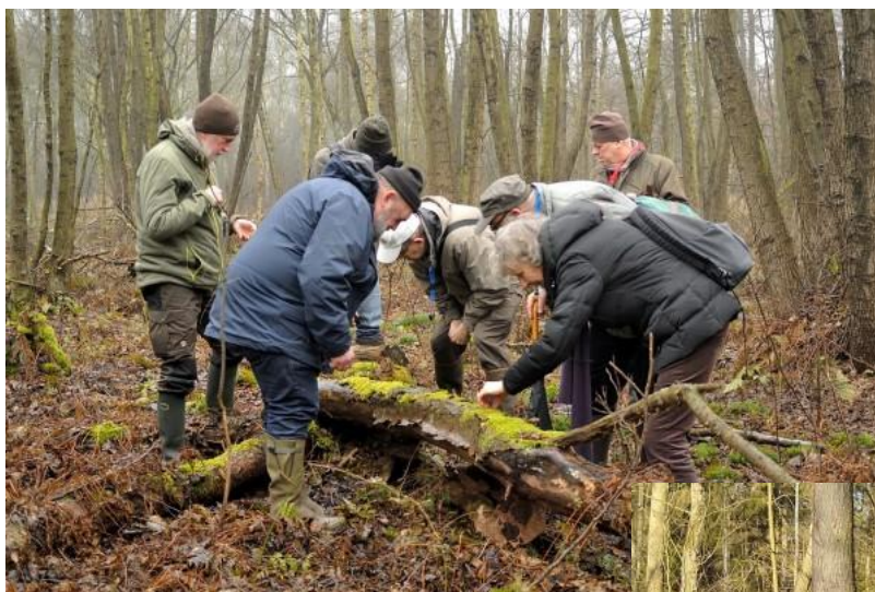
Op 7 februari wilden ze per sé allemaal naar dezelfde omgevallen boom kijken