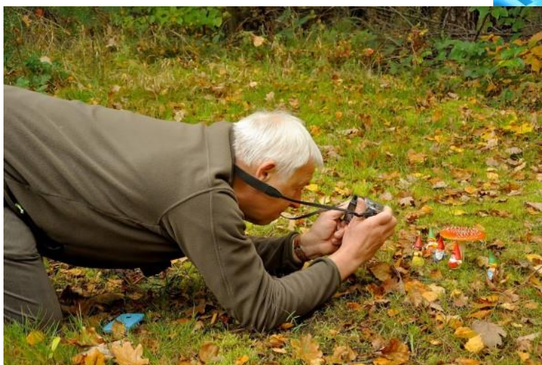
7 oktober en ze waren daar de kabouters