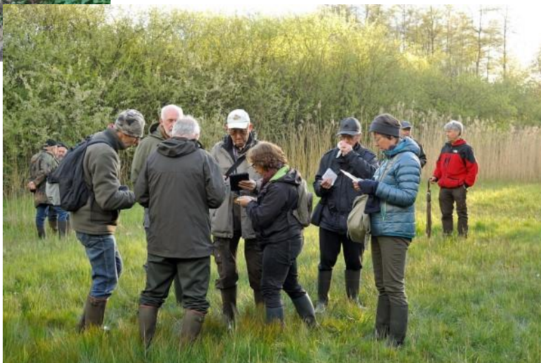
Op 25 april liep iedereen er dan ook goedgemutst bij