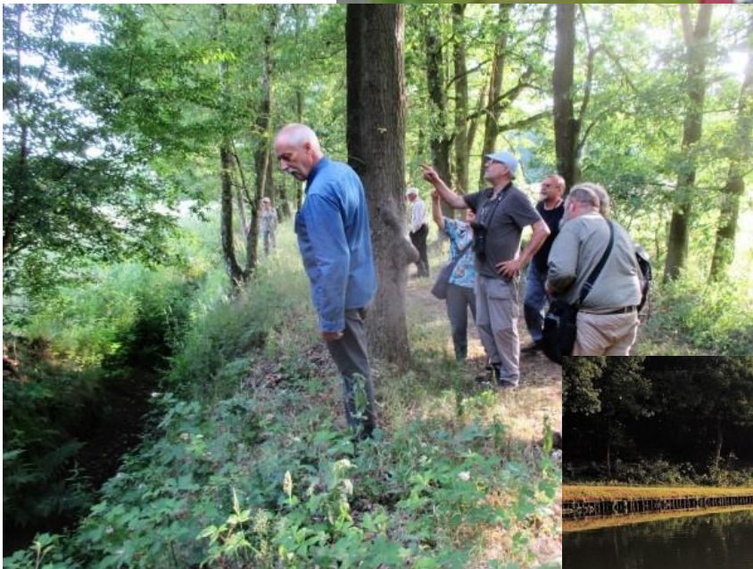
Het was 21 juni en de gids maar naar boven wijzen maar.....