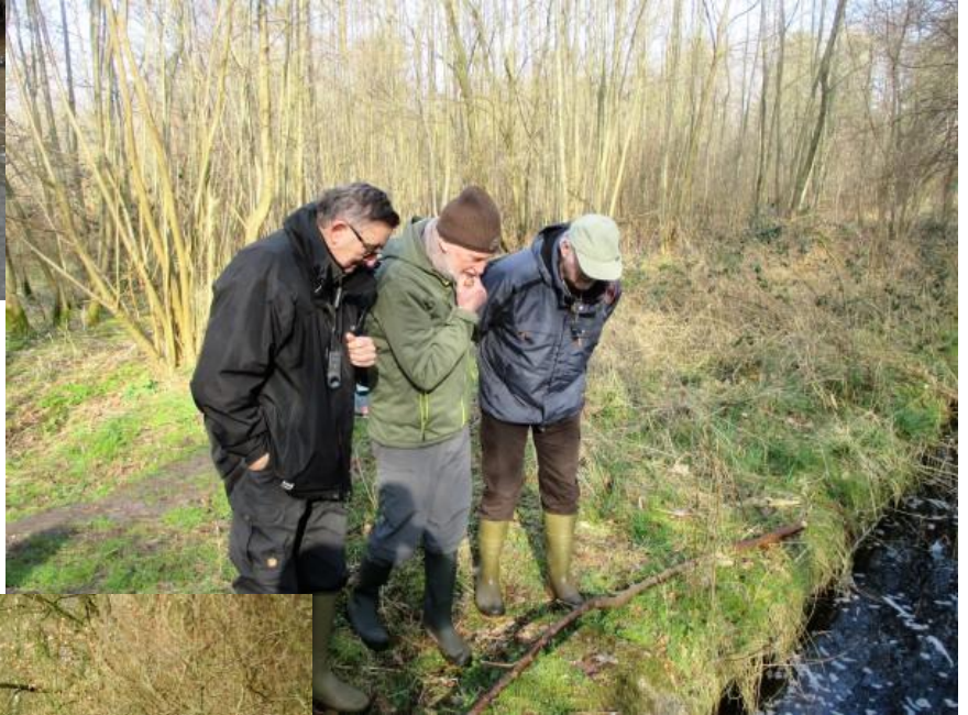
Op 14 maart zaten we met de vraag of Nicole wel terug zou boven komen.