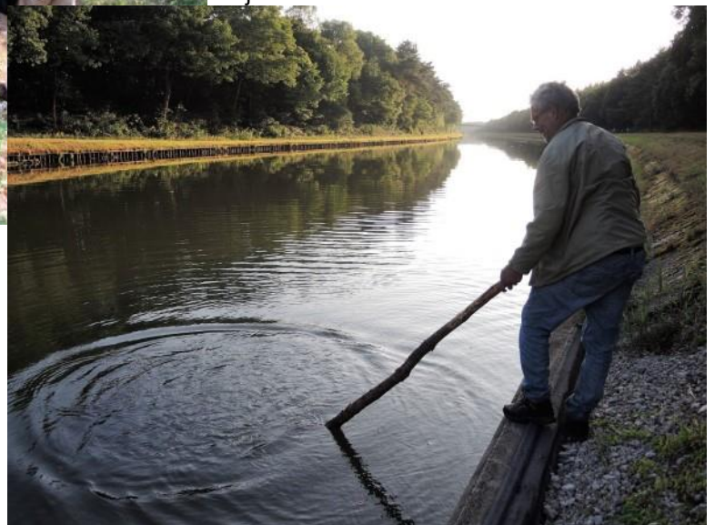
Dat moet ne grote vis geweest zijn op 28 juni